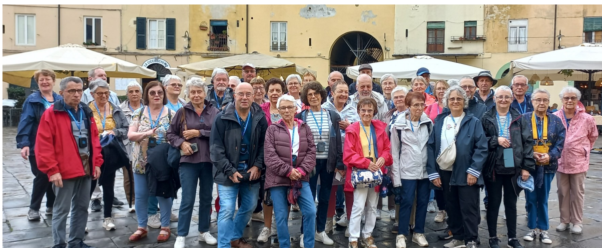
le groupe sur la place de l'Amphithéâtre à Lucques

Dimanche 25 janvier 2026 à 14 h, aura lieu notre traditionnel loto. L'ouverture des portes se fera à 13 h.30. Depuis plusieurs années, cette animation a connu un vif succès notamment avec