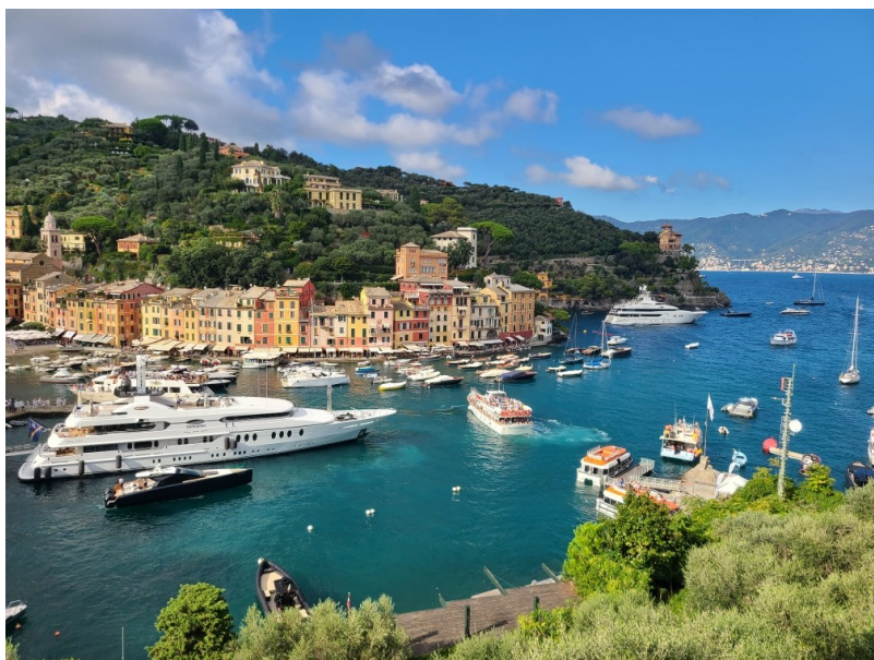
vue de Portofino